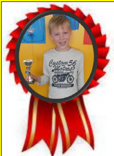
Samuel 4 e plek schaken