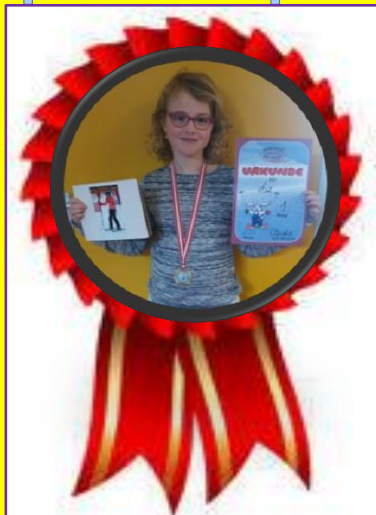
Liz 1 e plek skiën